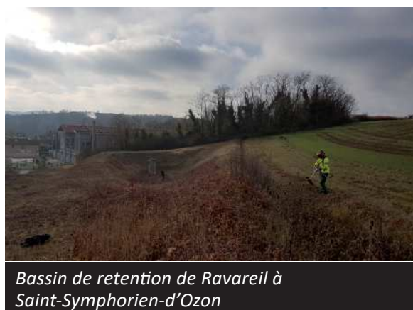
Bassin de rétention de Ravareil à Saint-Symphorien-d'Ozon