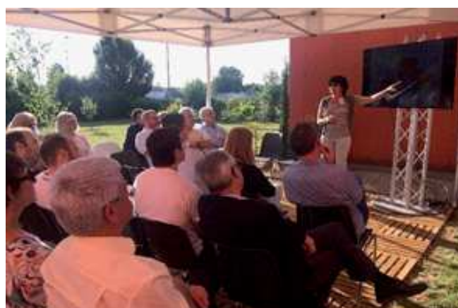
Société Tenor EDI parc d'activités de la Donnière à Marennes