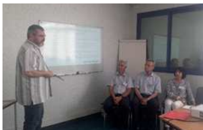
Société MTA parc d'activité de Chassagne à Ternay