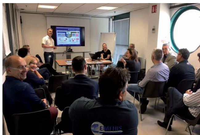
Société Martin BROWER parc d'activités du Chapotin à Chaponnay

La Communauté de communes avait pour objectif de présenter les actions des trois partenaires et permettre aux entrepreneurs, exerçant sur le même secteur géographique, de se rencontrer et d'échanger. La société «Martin Brower» a reçu les entrepreneurs de Chaponnay, «MTA» ceux de Sérézin-du-Rhône, Communay et Ternay et «Tenor EDI» ceux de Marennes, Saint-Symphorien-d'Ozon et Simandres. Une quarantaine d'entreprises ont ainsi assisté à chacune de ces rencontres qui ont permis de dresser le bilan de l'année 2017 et aborder les objectifs 2018.