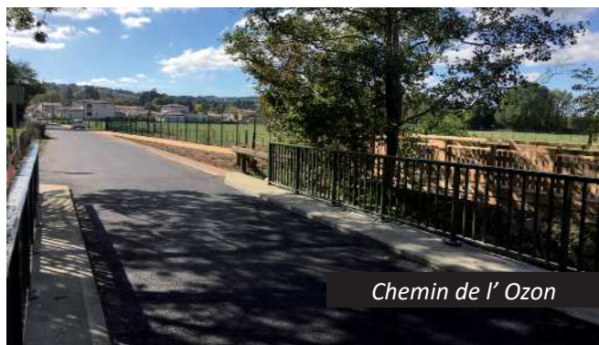
Chemin de l' Ozon