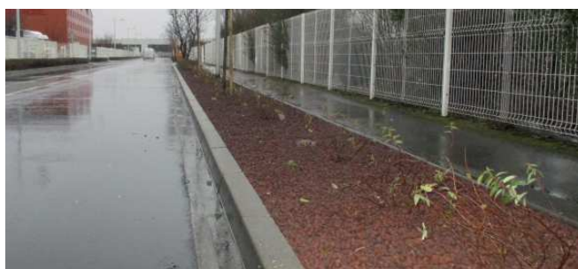
Plantation de végétaux au parc du Chapotin à Chaponnay

Plantations d'arbres dans le parc d'activités de la Donnières à Marennes et de végétaux au parc du Chapotin à Chaponnay.