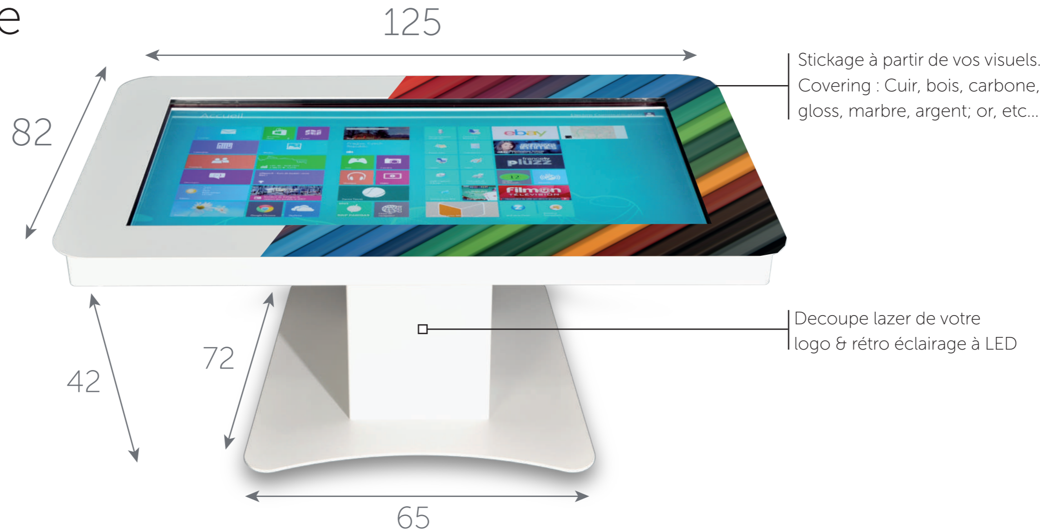
Vue de derrière